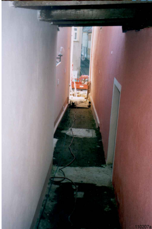
Foto izquierda: El trayecto de la perforación estaba entre estas dos casas. Profundidad de la fosa de destino: 4 m. El cabezal perforador llegó a su destino en tan sólo 45 minutos.