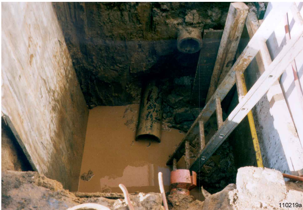
Foto arriba: Tiempo de colocación para 19 m de tubería de PE de alta densidad, DE 225 mm: 2 horas.